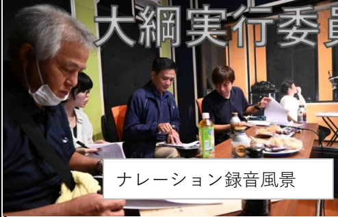
ナレーション録音風景